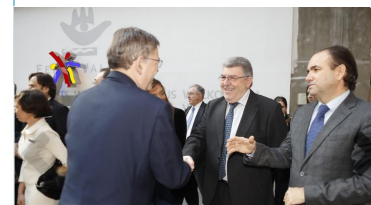
Galería de fotos de Cevisama 2017