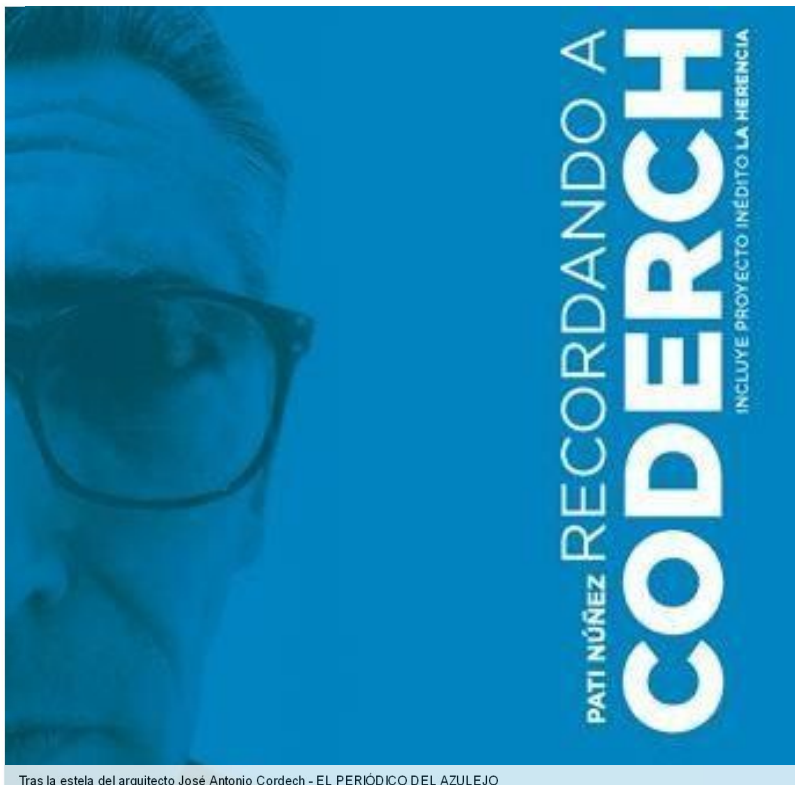
Tras la estela del arquitecto José Antonio Cordech - EL PERIÓDICO DEL AZULEJO